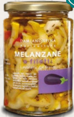
Melanzane a filetti Aubergine fillets CODE: DSA006 - 330 g