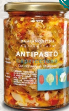
Antipasto capriccioso "Bruschetta Capriccioso" CODE: DSA001 - 330 g