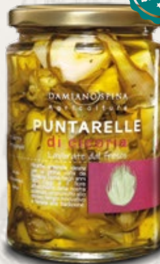
Puntarelle di cicoria Chicory "puntarelle" CODE: DSA004 - 320 g