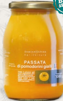
Passata di Pomodorini gialli Yellow Tomatoes purée DSA016 - 1000 g