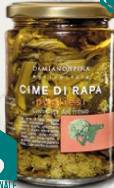
Cime di rapa pugliesi Apulian turnip tops CODE: DSA002 - 330 g