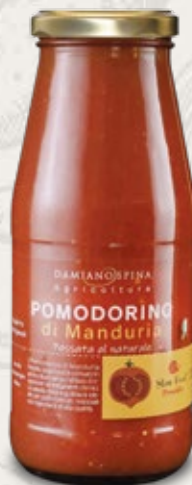
Passata al naturale di Pomodorino Little Tomato purée CODE: PSF002 - 330 g