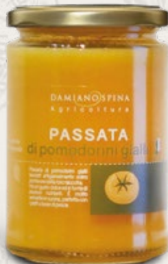
Passata di pomodorini gialli Yellow Tomatoes purée CODE: DSA011 - 330 g