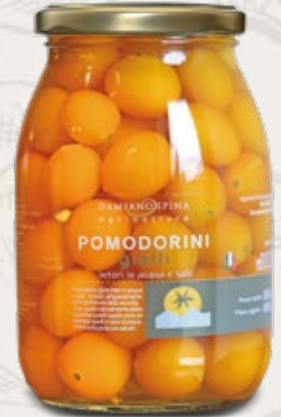
Pomodorino giallo intero in acqua e sale Yellow Tomatoes whole in salty water CODE: DSA018 - 950 g