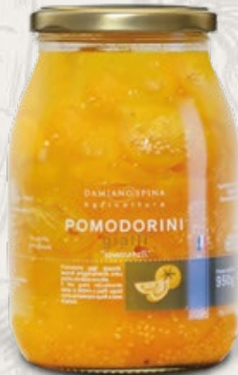
Pomodorini gialli "Spaccatelli" Yellow Tomatoes "Spaccatelli" DSA014 - 950 g