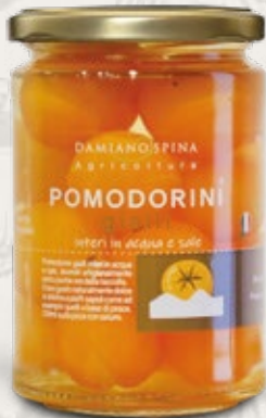
Pomodorino giallo in acqua e sale Yellow Tomatoes whole in salty water CODE: DSA017 - 330 g