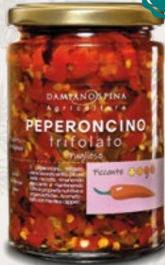
Peperoncino trifolato Spicy sautéed chili pepper CODE: DSA003 - 330 g