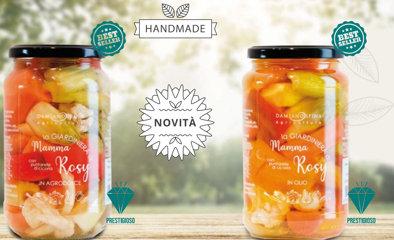
La Giardiniera di Mamma Rosy in agrodolce "Mom Rosy's Giardiniera" Mixed Pickles Sweet-and-sour CODE: VCO328 - 520 g | DSA023 - 1500 g