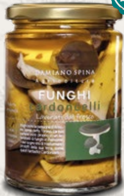
Funghi cardoncelli King oyster mushrooms CODE: DSA007 - 330 g