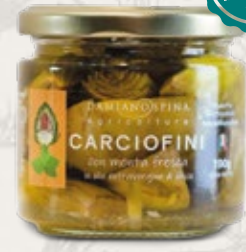
Carciofini con menta in olio EVO Artichokes with mint in EVO oil CODE: DSA013 - 190 g