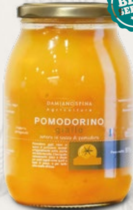
Pomodorino giallo in succo Yellow Tomato in juice CODE: DSA015 - 970 g