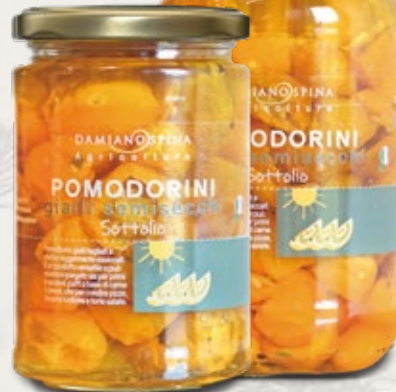
Pomodorini gialli semiseccati Semidry Yellow Tomatoes CODE: DSA019 - 330 g DSA020 - 520 g