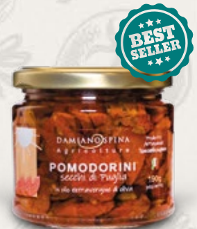
Pomodorini secchi di Puglia in olio EVO Little Apulian dry tomatoes in EVO oil CODE: DSA010 - 190 g DSA012 - 520 g