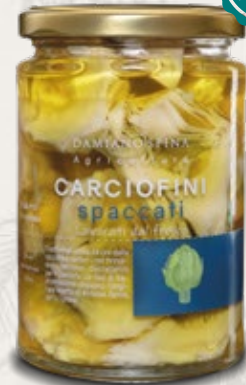
Carciofini spaccati Sliced baby artichokes CODE: DSA005 - 330 g