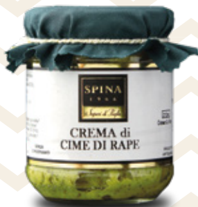
Crema di Cime di rape Turnip tops paté CODE: VSO131 -190 g