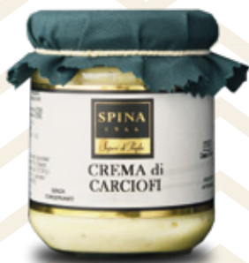
Crema di Carciofi Artichokes paté CODE: VSO126 -190 g