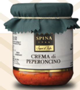
Crema di Peperoncino Chili Peppers paté CODE: VSO134 |190 g