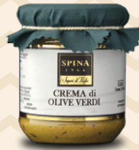
Crema di Olive Verdi Green olives paté CODE: VSO129 -190 g