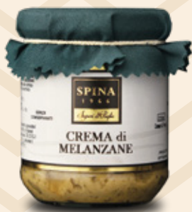
Crema di Melanzane Aubergines paté CODE: VSO133 -190 g