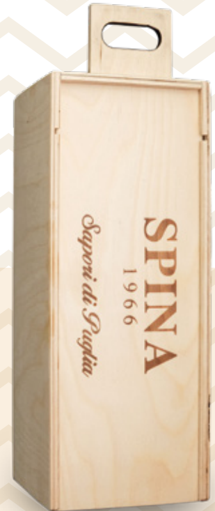
Cassetta Linea Elegance con tagliere Solid wood Elegance Line with a cutting board CODE: 11564