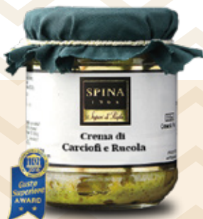
Crema di Carciofi e rucola Artichokes paté with rocket CODE: VSO127 -190 g