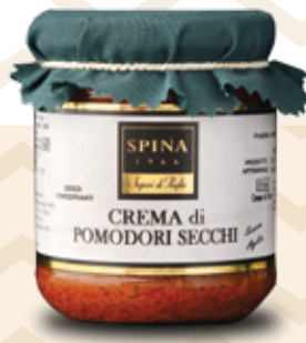
Crema di Pomodori Secchi Sundried tomatoes paté CODE: VSO130 -190 g