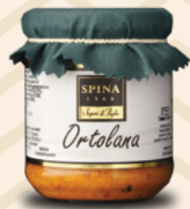
Ortolana Mixed vegetables paté CODE: VSO136 -190 g