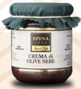
Crema di Olive Nere Black olives paté CODE: VSO128 -190 g